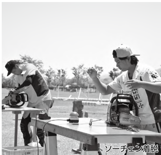
ソーチェーン着脱