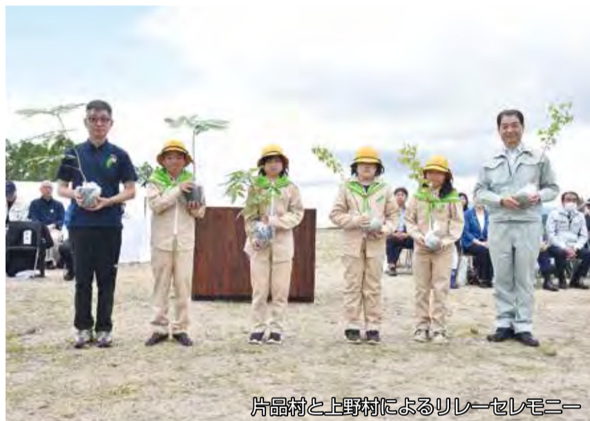
片品村と上野村によるリレーセレモニー