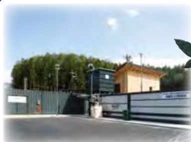
木質バイオマス発電「森林の発電所」