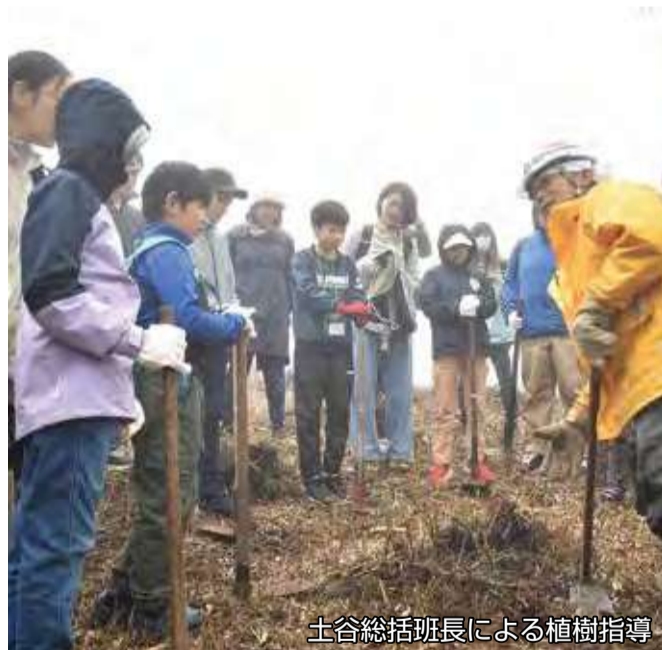
土谷総括班長による植樹指導