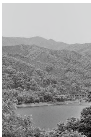
表紙 草木湖（みどり市）