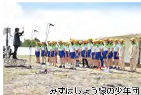
みずばしょう緑の少年団